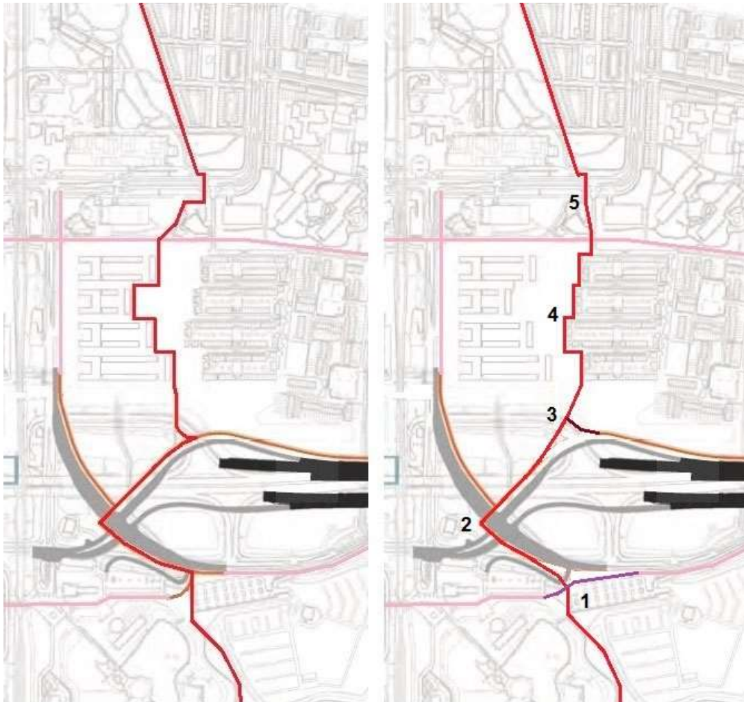
Route Gaasperparkpad : links Rijkswaterstaat , rechts voorstel Fietsersbond

Voor de herkenbaarheid en oriëntatie van de route hebben we 6 aandachtspunten: