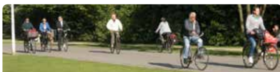
Vanuit de belangrijkste fietsroutes in één beweging de IJfietsstunnel in.

Vanuit 20m onder NAP is het nog een flinke klim: geen probleem voor getrainde fietsers of E-bikers. Voor mensen die zonder inspanning meteen bij de oever naar boven willen plaatsen we extra stijgpunten. Deze nieuwe entrees zorgen voor een perfecte aansluiting op de belangrijkste fietsroutes en brengen dynamiek op plekken die de komende jaren steeds belangrijker worden in de stad.