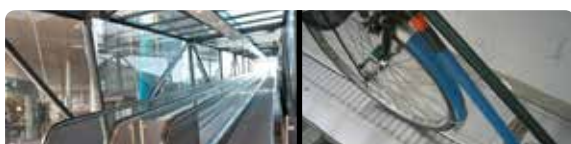
comfortabel naar boven met glazen, lift, rolbaan of sleep-lift voor de fiets