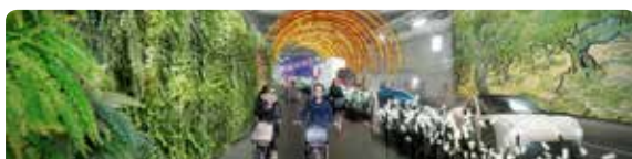
fietsers genieten van de wisselende sferen, geflankeerd door elektrische voertuigen (max. 50km/u)