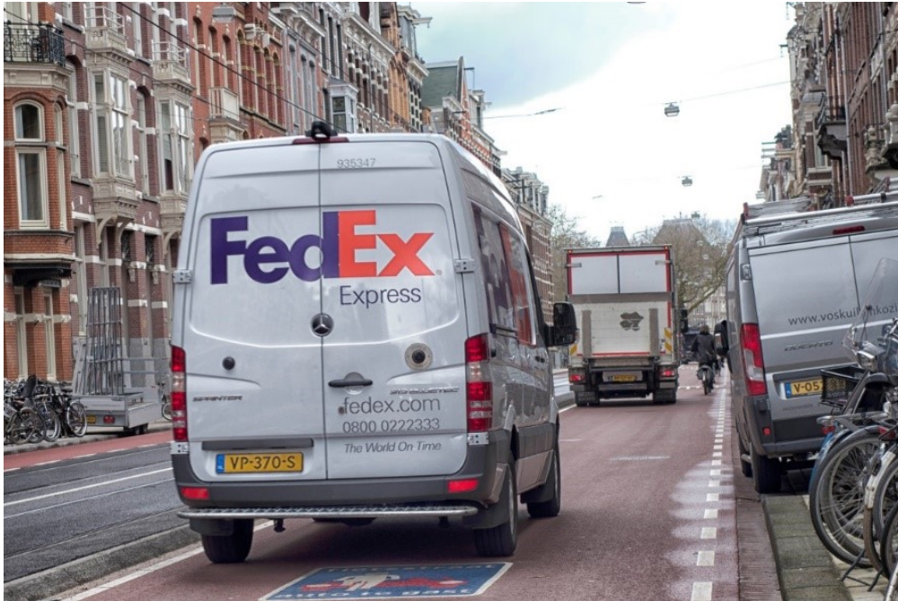
Fietser in de knel op de fietsstraat Weteringschans-oost.

Nog erger is een te smalle rijbaan op een rijweg voor gemengd verkeer die te druk is voor een fietsstraat. Dat dreigt zich voor te doen in het plan voor de Nieuwezijds Voorburgwal-Noord, waar een rijweg noord-zuid van slechts 3,85-4,00 m breed getekend staat.